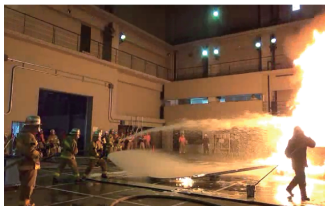
実火災体験型訓練(危険物火災)