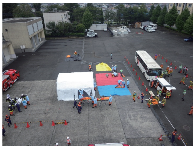
複数課程で実施する多数傷病者対応訓練